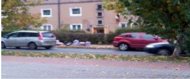
La voiture d'Azertuploit observée à Joliette